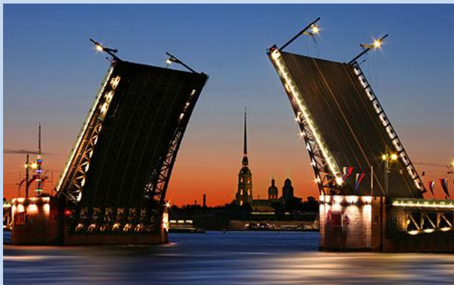
Abendlicher Blick auf die Uferpromenade, unweit von Ihrem Hotel!