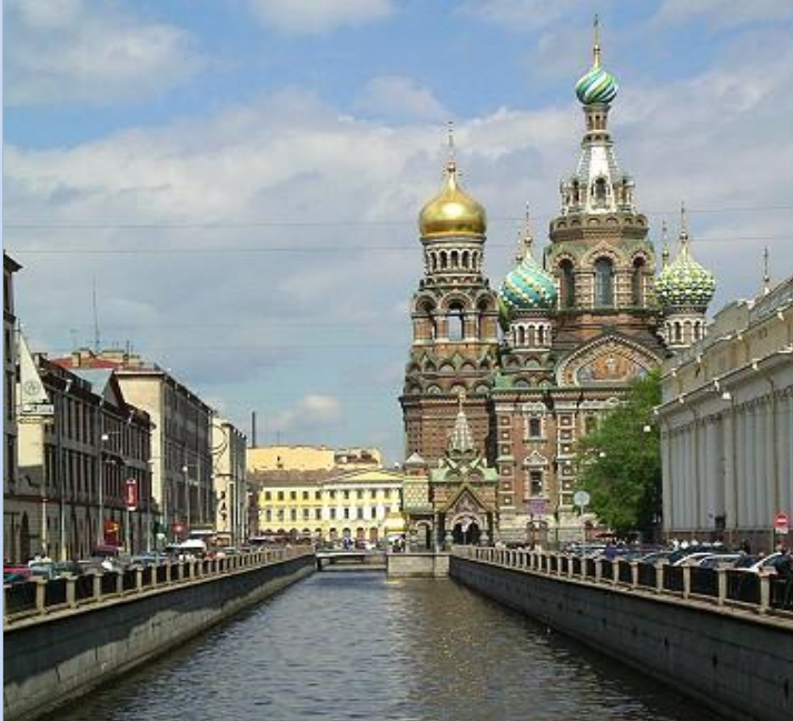
Die Auferstehungskathedrale am Gribojedowa Kanal