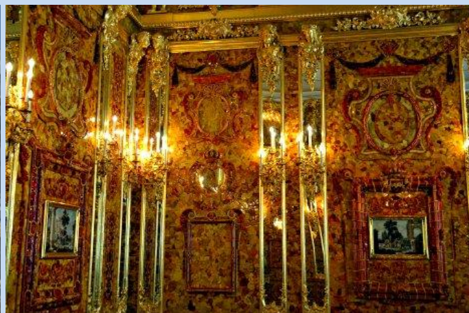
Das legendäre Bernsteinzimmer