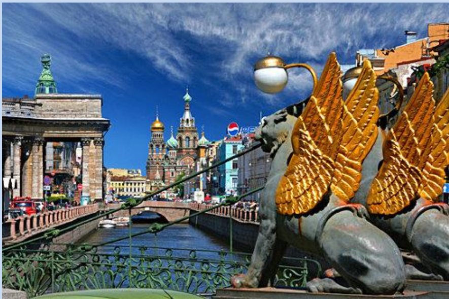
Griboedowa Kanal am Newski Prospekt.