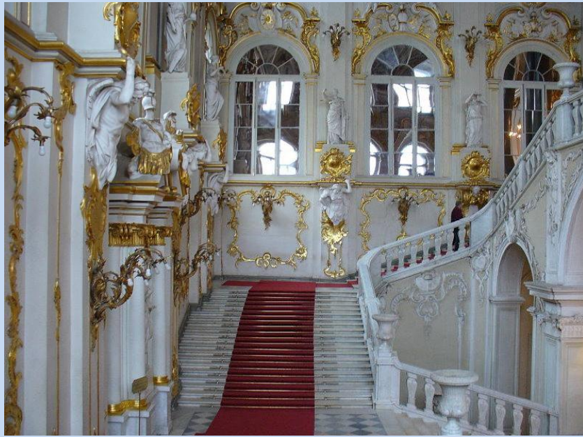
Ermitage / Winterpalast