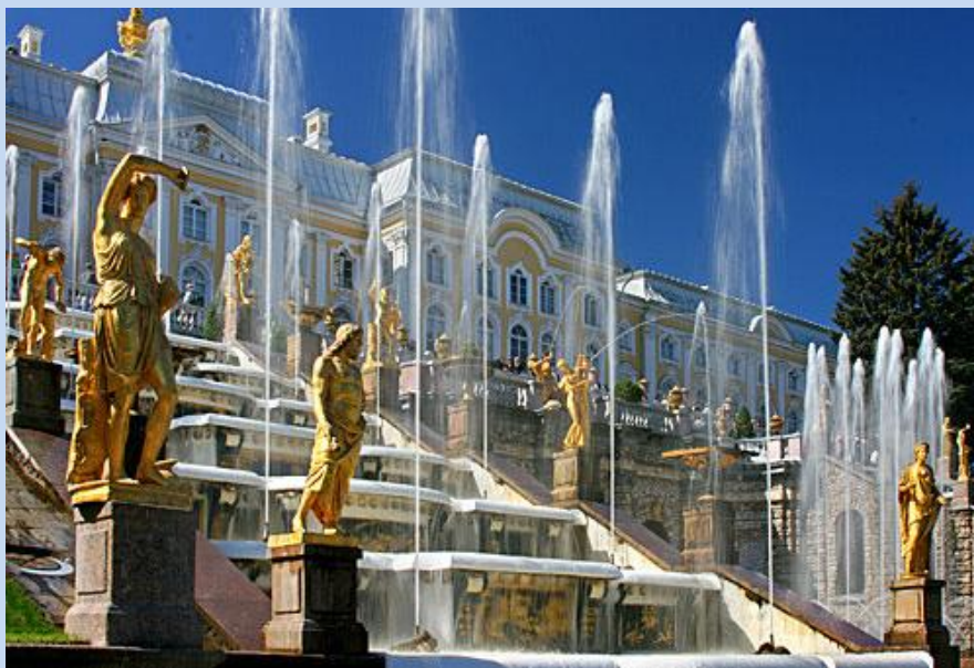
Zarenresidenz Peterhof, Die Große Kaskade