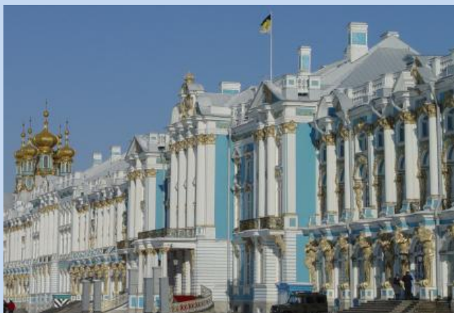
Katharinenpalast in Puschkin