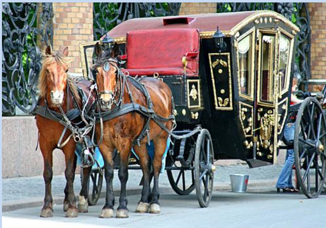
Kutschenfahrt wie zu Zarenzeiten