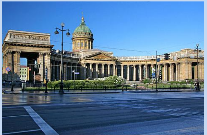
Die gradiose Kasaner-Kathedrale