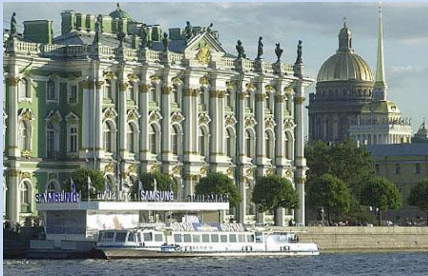
Schloßkai an der Eremitage